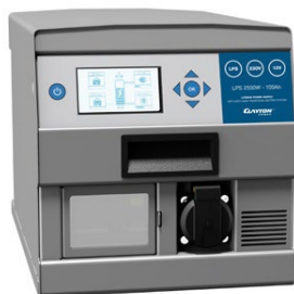
LPS 2500 W batterigenerator